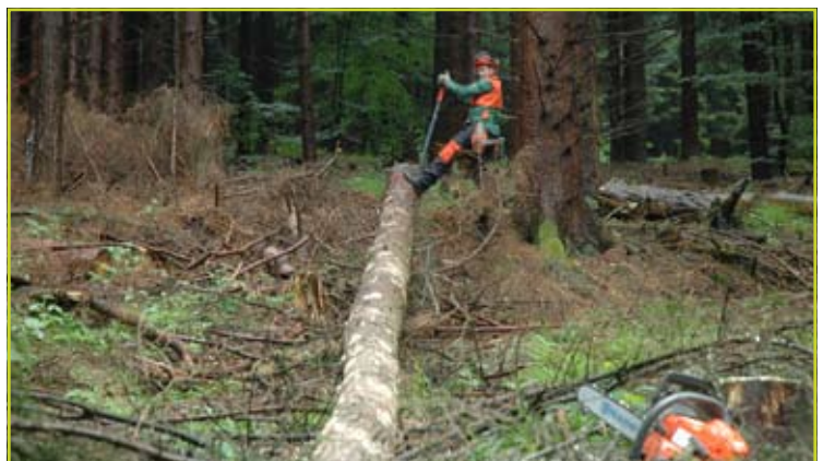
Figuur 2: Boomstammen omdraaien tijdens het onttakken is een klassieke toepassing van de kantelhaak. Hier wordt een halfonttakte fijnspar gedraaid.

Tot slot nog een toepassing van de kantelhaak die je veel plezier zal opleveren bij het doorzagen van boomstammen. Dikke stammen moet je, als het zaagblad te kort is, kantelen om er volledig door te geraken. Het lijkt op het eerste zicht onnodig om dunne stammen te draaien, maar het voordeel is dat je daardoor zeker niet in de grond zaagt en je zaagketting lang scherp blijft.