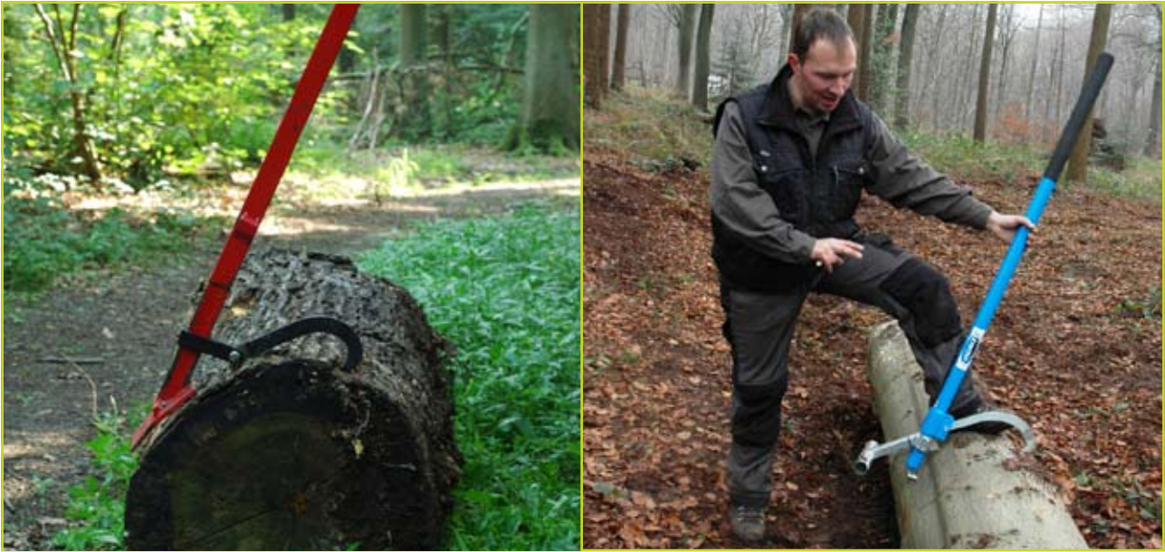
Figuur 3: Gecombineerde velhevels/kantelhaken (links) hebben als voornaamste nadeel dat de kantelhaak zich dikwijls niet goed in het hout vastbijt. Op dat vlak werken enkelvoudige kantelhaken (rechts) stukken beter.

De meest gebruikte velhevels zijn voorzien van een kantelhaak. Deze gecombineerde velhevels/kantelhaken hebben als voornaamste nadeel dat de kantelhaak niet altijd perfect werkt en zich bijgevolg dikwijls niet goed in het hout vastbijt. Op dat vlak zijn enkelvoudige kantelhaken (met aluminium of houten steel) stukken beter. Zeker voor