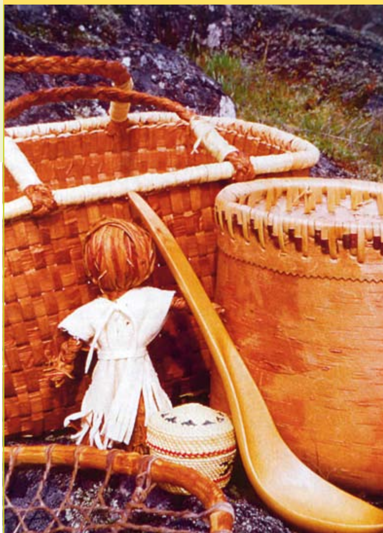
Figuur 1: Sneeuwschoen met taxushout ( Taxus brevifolia ), pop van wilgebast ( Salix sp.), geweven mand van levensboombast ( Thuja plicata ), mand van berkebast met een rand van levensboom- en vogelkersbast ( Prunus emarginata ), lepel van berkehout ( Betula papyrifera ) en mandje van een zeggesoort ( Carex obnupta ).

ning, kledij en gebruiksvoorwerpen zijn grotendeels van plantaardige oorsprong, terwijl de Maya's zich van hen onderscheiden door indrukwekkende stenen steden zoals Palenque en Tikal. Het plantaardig fundament van de Haida-cultuur wordt ondersteund door archeologische vondsten op plaatsen waar plantenresten van 'bodervertering' worden gevrijwaard (bijvoorbeeld omdat ze door met water verzadigde modder zijn bedekt). Vandaar het idee om de term technofyticum te lanceren (fytos is Grieks voor plantaardig).