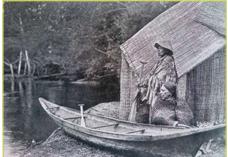
Figuur 3: Visserskamp met matten van lisdodde ( Typha latifolia ), waterbestendige kledij met levensboombast en kano van levensboomhout.

keuze om houtbewerkers van wiggen en vissers van haken te voorzien. Met de bast van de sitkaspar ( Picea sitchensis ) worden nog steeds kook- en draagmanden vervaardigd. Daarbij dienen de wortels voor de naden en met gesmolten hars kan het geheel waterdicht worden gemaakt. Figuur 3 laat een overwegend plantaardig visserskamp in een ander deel van British Columbia zien. Met de Haida's en hun