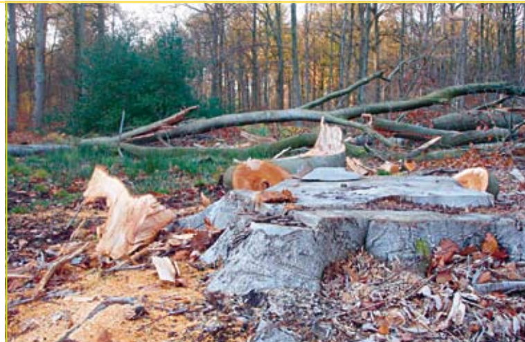
Figuur 2: Het resultaat na een groepenkap (Meerdaalwoud).