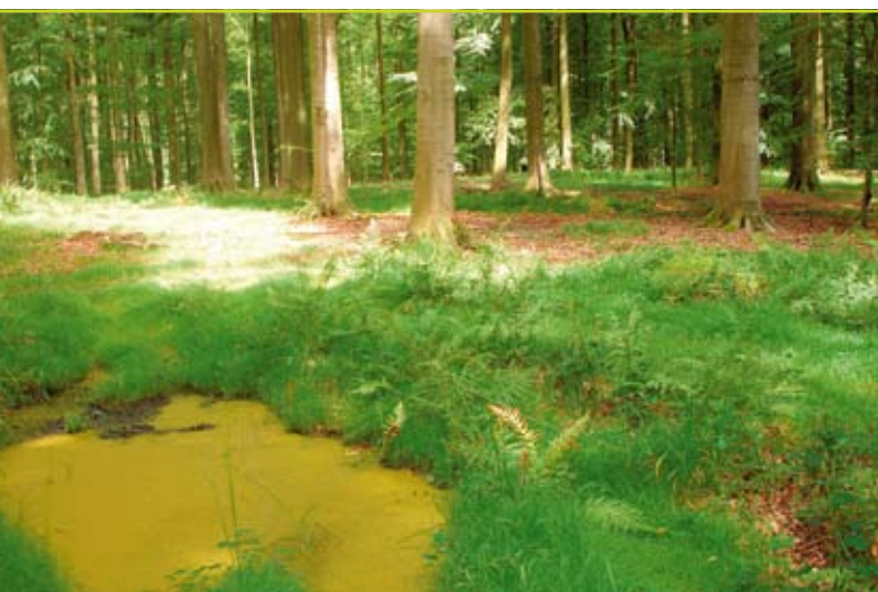
Figuur 1: Rijsporen van een conventionele skidderexploitatie (Zonienwoud). De frisgroene kleur is afkomstig van ijle zegge ( Carex remota ), een typische plant voor verdichte situaties.

Met bodemschade wordt hier voornamelijk bodemverdichting en bodemverstoring bedoeld. Dit is niet alleen ongunstig voor de kruidlaag en het bodemleven, bodemverdichting kan ook een negatief effect hebben op de productiviteit van de groeiplaats en bijgevolg op de opbrengst. Om de financiële impact van bodemverdichting te begroten werd gebruik gemaakt van de grondverwachtingswaarde. Dit is de verdisconteerde som van alle inkomsten en uitgaven die zich voordoen tijdens een bedrijfstijd. Tot de uitgaven behoren bijvoorbeeld de kosten voor de aanplant en de eerste vrijstellingen. De opbrengsten worden gegenereerd door de dunningsproducten en de eindkap. De bodemschade werd dan berekend door de bereiden oppervlakte te vermenigvuldigen met de grondverwachtingswaarde.