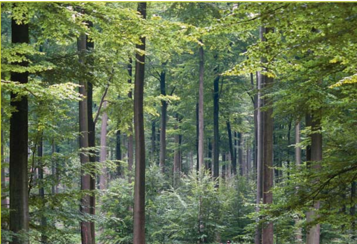
Figuur 1: Zoniënwoud anno 2010, bekend om zijn kathedraalbestanden van beuk.

argileuse, partie glaiseuse, partie humide, partie légère, partie sablonneuse... En toch staat hier bijna overal dezelfde boomsoort! Il convient donc de donner à ces différentes sortes de terre les diverses espèces de bois que la nature a destinée à chacune d'elles. Er moeten hier dus meer 'standplaatsgeschikte' boomsoorten komen. De beuk verkiest les terrains secs et légers en mag in elk geval niet zomaar overal worden neergepoot. De vochtige plekken moeten worden gereserveerd voor els, ratelpopulier, zwarte populier en es. Op andere bodems horen haagbeuk, linde, den en