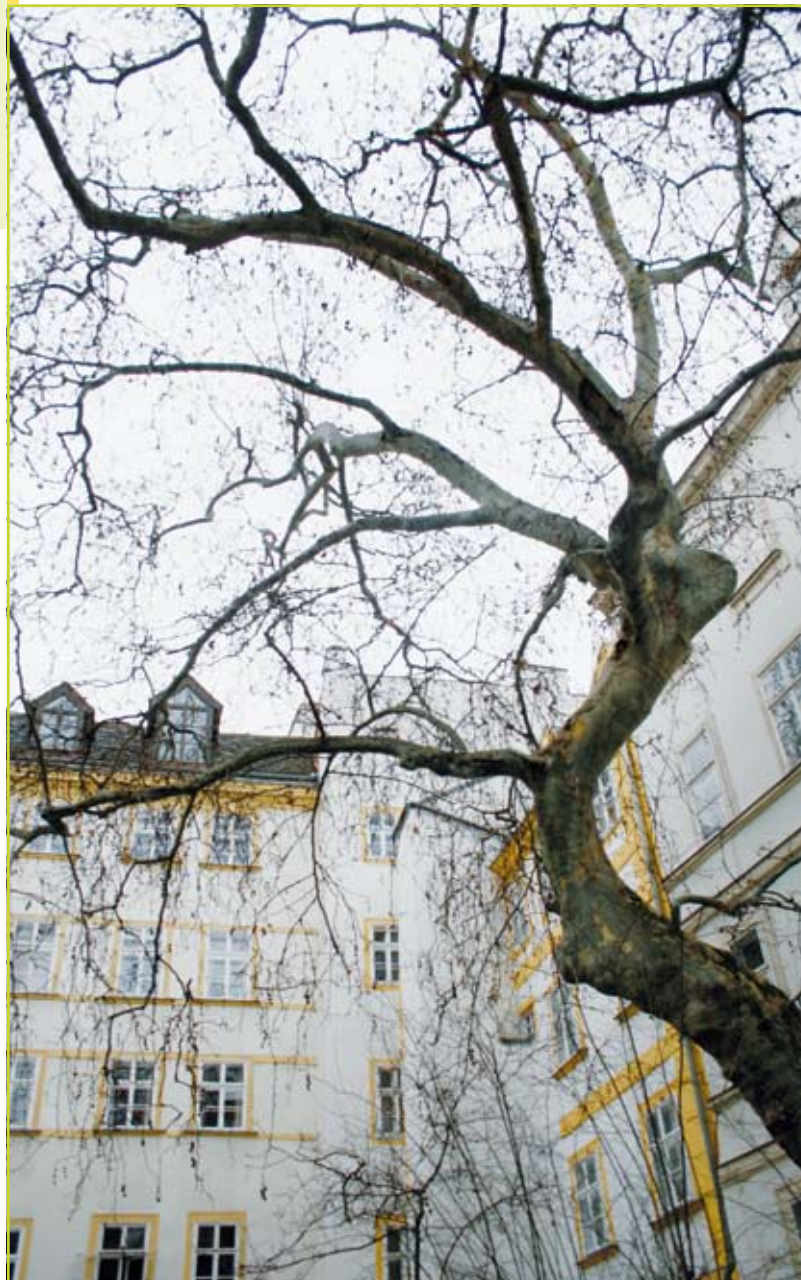
Figuur 1: Bomen in de stad hebben verschillende functies. Ze verbeteren ons fysieke en mentale welzijn door allerlei milieueffecten, bevorderen biodiversiteit in de stad en hebben uiteraard ook vaak een hoge esthetische waarde.

ROELAND SAMSON, KAREN WUYTS, SHARI VAN WITTENBERGHE & TATIANA WUYTACK (Departement Bio-ingenieurswetenschappen, Universiteit Antwerpen)