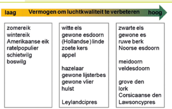
Figuur 4: Rangschikking van boom- en struiksoorten courant voorkomend in stedelijk milieu, naar hun vermogen om luchtkwaliteit te verbeteren op basis van hun capaciteit om pollutanten weg te vangen en hun emissie van biogene vluchtige organische stoffen (naar Donovan et al. 2005 en Hewitt 2006)

Het spreekt voor zich dat bomen, en groen in het algemeen, een onmisbare schakel vormen in landelijke, maar zeker ook in stedelijke gebieden waar zij een ecologisch, sociaal, economisch en psychologisch effect hebben met een positieve bijklank voor de menselijke gezondheid vanwege hun luchtfilterende en verkoelende werking. Bepaalde boomsoorten hebben echter een minder prettige kant, met een negatief effect op de luchtkwaliteit of allergische reacties tot gevolg.