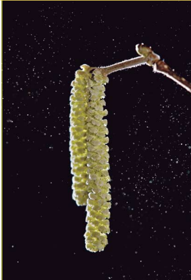
Figuur 3: Verschillende bomen produceren allergene pollenkorrels. De mate waarin ze allergische reacties opwekken verschilt van soort tot soort. Hier zien we een katje van hazelaar in volle actie.

Omwille van de grote verscheidenheid aan BVOS, de manier waarop hun vorming en vrijstelling tot stand komt