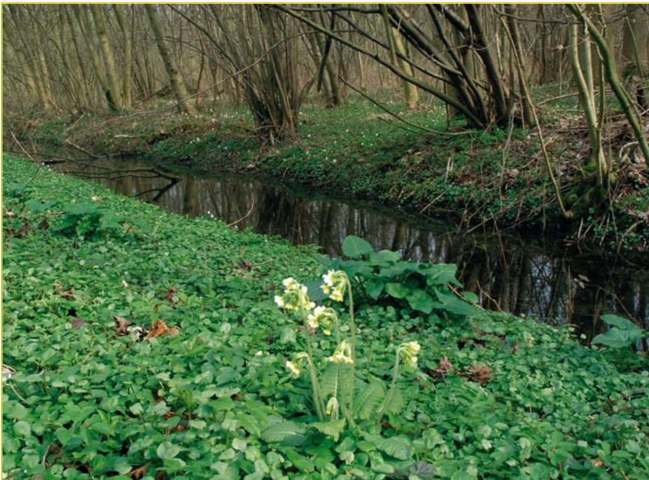
Figuur 3: Oudbosplanten (slanke sleutelbloem, bosanemoon en gevlekte aronskelk) koloniseren recent bos (voorgrond, met dominantie van speenkruid) vanuit oud bos (achter de gracht).

geconcentreerd door forse lichtminnende soorten. Dit verklaart de negatieve effecten van een kaalslag, waarbij alle bomen en struiken worden verwijderd. Het herstel van een bosklimaat duurt lang waardoor de dominantie van competitieve, lichtminnende plantensoorten, bijvoorbeeld bramen, te lang aanhoudt. Een beheer waarbij na de kap een snel herstel van schaduw door struiken en bomen wordt nagestreefd, is veel gunstiger: (oud)bosplanten krijgen even extra licht om te bloeien en zaad te vormen, terwijl lichtminnende soorten niet de kans krijgen om langdurig te domineren. Een hakhout- of middelhoutbeheer, maar ook een eindkap waarbij de struiklaag en natuurlijke verjonging zoveel mogelijk worden behouden, zijn veel gunstiger voor oudbosplanten.