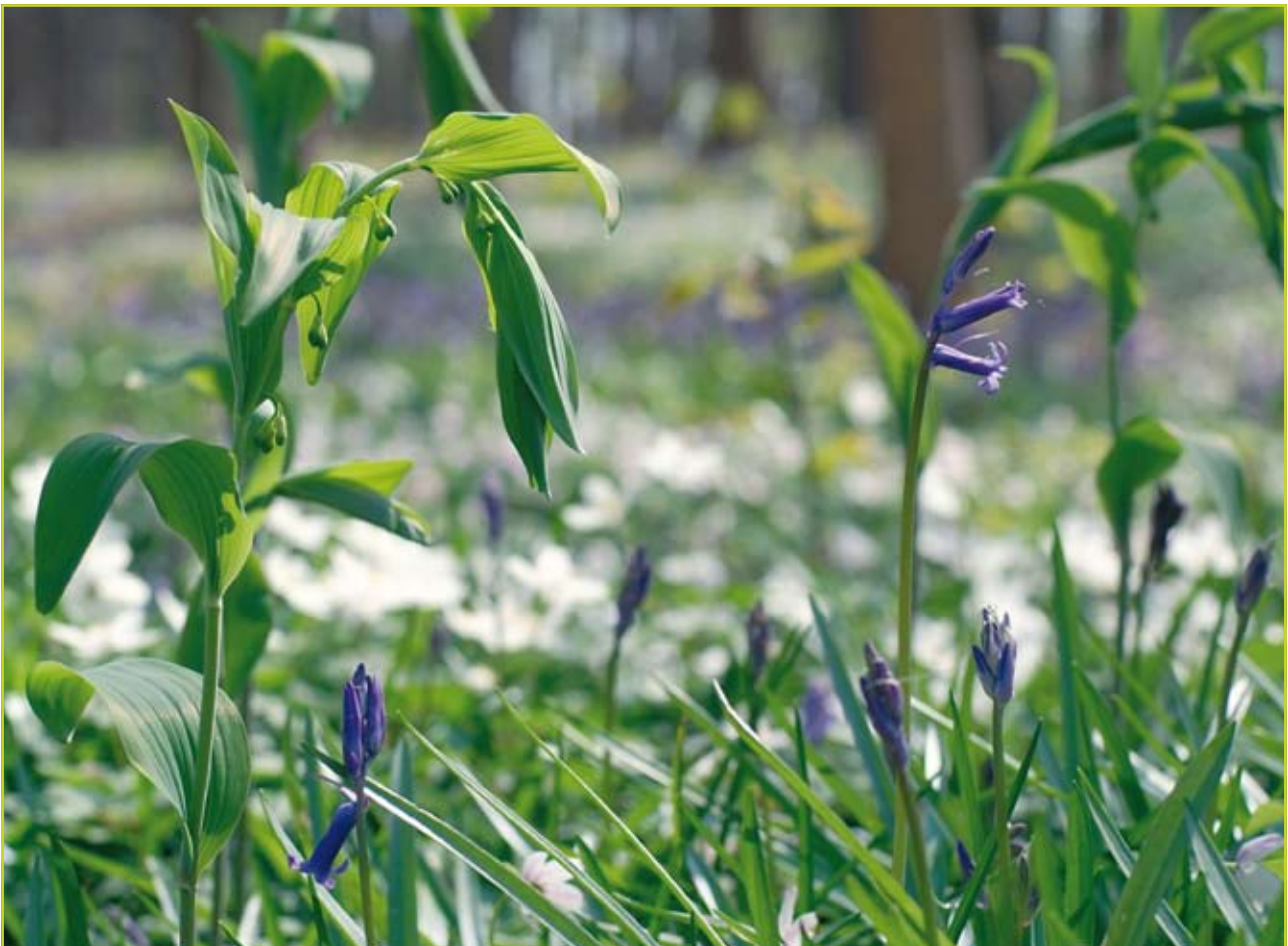
Figuur 1: In oud bos op leem zijn wilde hyacint, veelbloemige salomonszegel en bosanemoon karakteristieke voorjaarsbloeiers.

Daar staat tegenover dat oudbosplanten overleven in omstandigheden die voor vele plantensoorten ongunstig zijn, met name diepe schaduw. Hiervoor hebben ze uiteenlopende strategieën ontwikkeld. Vele oudbosplanten ontwikkelen zich vroeg in het voorjaar, waardoor ze kunnen groeien, bloeien en zaad ontwikkelen vóór het kronendak volledig gesloten is. Bosanemoon en wilde hyacint zijn voorbeelden bij uitstek van een dergelijke strategie. Sommige soorten zijn halfwintergroen of wintergroen, zoals bijvoorbeeld heelkruid, witte klaverzuring, gele dovenetel en kleine maagdenpalm. Nog andere soorten kunnen zeer lang vegetatief overleven in diepe schaduw, maar bloeien pas uitbundig als er wat meer licht in het bos valt, door kap of door een natuurlijke verstoring. Een voorbeeld hiervan is de wilde narcis. Adelaarsvaren, een kenmerkende oudbosplant van bossen op zure bodem, investeert