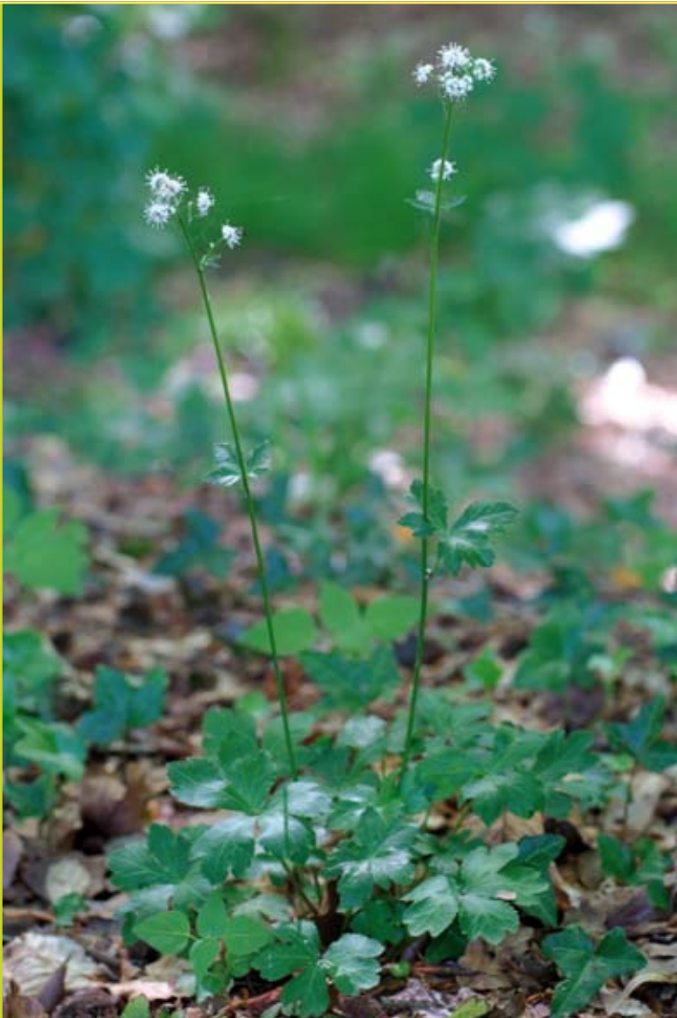
Figuur 4: Heelkruid is een vrij zeldzame oudbosplant met een voorkeur voor kalkrijke bodem, hier in het gezelschap van groot heksenkruid en klimop.