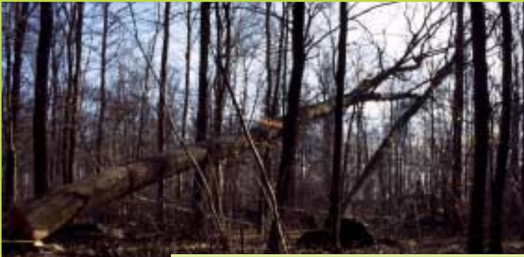
Als dikke Amerikaanse eiken vallen, worden ondanks veel voorzorgen wel eens kleinere bomen meegesleurd...