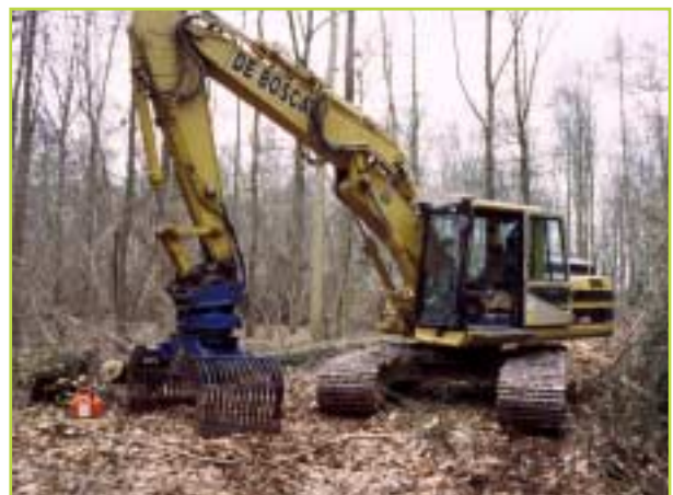
De rupskraan met klem: de beweeglijke kraanarm is een voordeel, maar een lier ontbreekt zodat de reikwijdte van de machine eerder beperkt is

De aannemer met de rupskraan had goed werk geleverd bij de kappingen in de bosranden, en was bereid de exploitatie uit te voeren. Stapelplaats was ook geen probleem meer, omdat intussen de bosrand vrijgemaakt was. Het uitslepen van de stammen was een ander paar mouwen: met de klem van de rupskraan kan een stam van op ongeveer 10 m bijgetrokken worden, maar als hij verder ligt, is er een probleem. De rupskraan van 24 ton mocht immers niet van de vaste ruimingspistes afwijken.