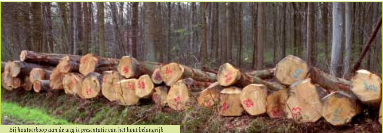
Bij houtverkoop aan de weg is presentatie van het hout belangrijk