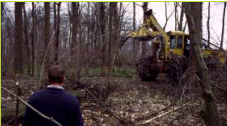
Indien mogelijk werden stammen uitgekabeld van op de bestaande boswegen

beetje verleggen tot aan de stapelplaats is perfect mogelijk. Na een korte gewenningsperiode was de aannemer helemaal weg met het systeem van vaste ruimingspistes. Alle pistes werden zonder fout aangehouden.