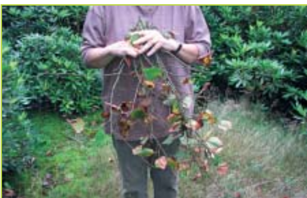
Snoeiafval na uitvoeren van onderstandige snoei.

Voor het aanmaken van deze barrière heeft de boom alle gewenste energie en tijd. Dit houdt in dat deze barrière