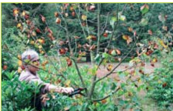
Plaats waar volgens de klassieke methode gesnoeid zou worden.

Bij bomen in een dicht plantverband sterven de onderste takken, eens ze in de schaduw komen van de boom zelf en/of in dat van zijn burens, sowieso vanzelf af. In dit geval kan de beheerder zich beperken tot het afzagen van de dode takken, wat verschillende voordelen heeft. Een boom slaat geen energiereserves op in dode takken, het wegnemen ervan resulteert dus niet in een verlies van suikers of andere bouwstoffen die de boom nog zou kunnen benutten.