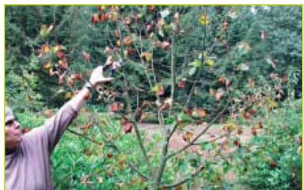
Plaats waar met onderstandige snoei gewerkt kan worden.