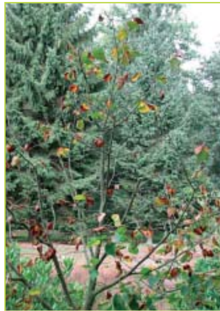
Resultaat na onderstandige snoei.