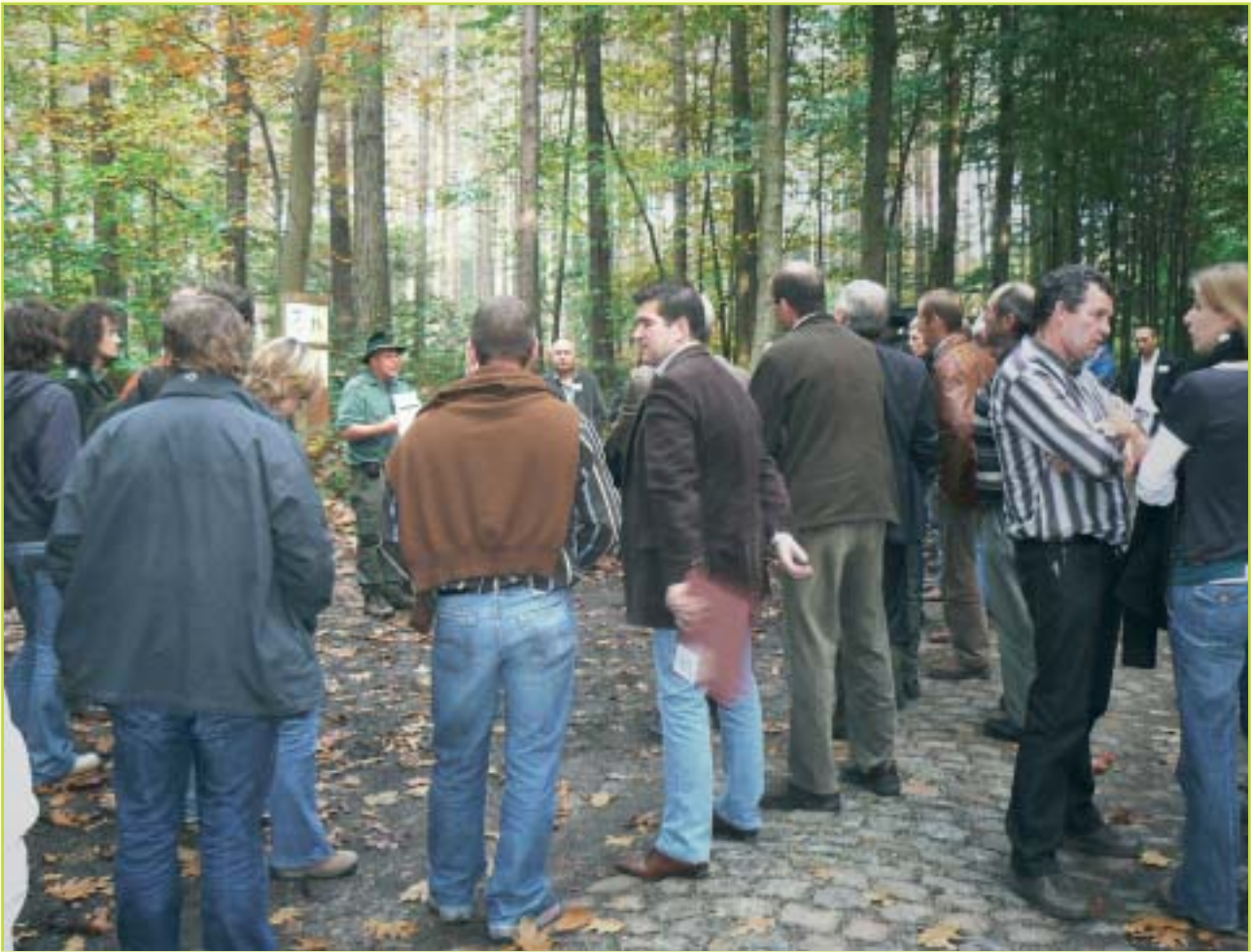
Tijdens de excursie werd heel wat nagepraat over het bosbeheerdersforum.

Wat de exploitatie van onze bossen betreft zou de erkenningsregeling voor bosexploitanten ook ingang moeten vinden in privé-bossen. Dit kan via de bosgroepen en waarschijnlijk is hieromtrent ook een wetsverandering opportuun. In 1999 waren de geesten nog niet rijp om het overal toe te passen. De meeste bosgroepen werken nu reeds enkel met erkende bedrijven.