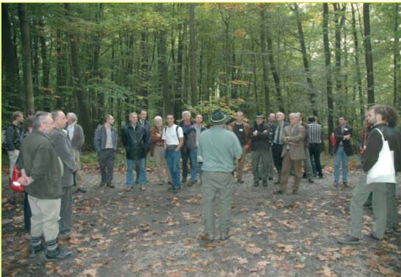
De geslaagde dag werd afgesloten met een excursie in Meerdaalwoud.

belangrijk dat op lokaal niveau gewerkt wordt en via intens overleg met de betrokken landbouwers. Als knelpunt werd de lage vergoeding naar voor geschoven. Als landbouwers een economisch voordeel zien in de bebossing dan kan bereidheid ontstaan (hier werd ook verwezen naar industrie- of woonuitbreidingsprojecten die doorgaans tot minder weerstand aanleiding geven bij de landbouwsector). Een schepen van een Vlaams-Brabantse gemeente gaf ook aan dat landbouwers in haar gemeente bereid waren om bosuitbreidingprojecten te integreren in hun bedrijfsvoering indien de opbrengst groter zou zijn dan de klassieke landbouwopbrengsten op de betrokken percelen. De Europese subsidies voor bosbeheer zouden wel te laag zijn t.o.v. landbouwsubsidies.