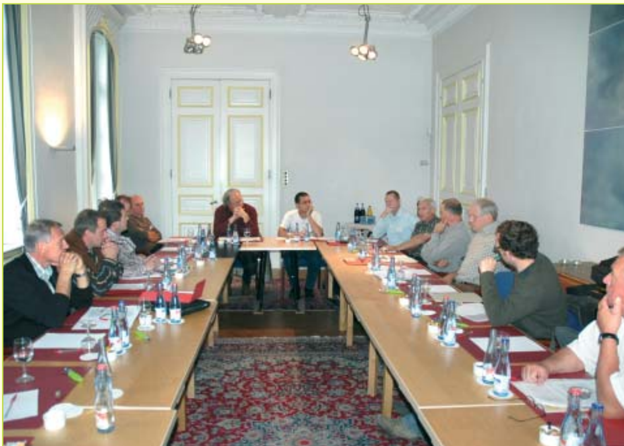
Deze discussiegroep boog zich over het thema 'Bosuitbreiding: een zaak van openbare én private boscijneers?'.

aan bosuitbreiding gedaan wordt. Dit is met het huidige systeem, waarbij vooral reeds bestaande bossen gekocht worden, niet het geval.