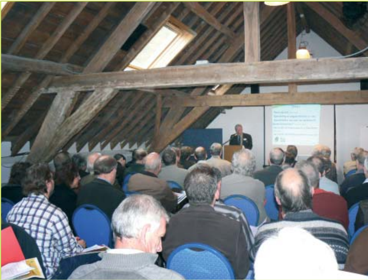
Het bosbeheerdersforum werd geopend in plenum met een voorstelling van de 5 discussiethema's, ingeleid door een privé-boseigenaar.

Een andere mogelijkheid is het onderschrijven van de criteria duurzaam bosbeheer (of andere duidelijke criteria) op te nemen in de akte van aankoop van de te bebossen gronden of bossen. Door de privé-eigenaar deze keuze voor te leggen bij de aankoop van gronden binnen de perimeters wordt de visie van de overheid ook gerealiseerd. Als hij de criteria duurzaam bosbeheer niet onderschrijft, kan de overheid besluiten om toch over te gaan tot uitoefening van het voorkeepsrecht.