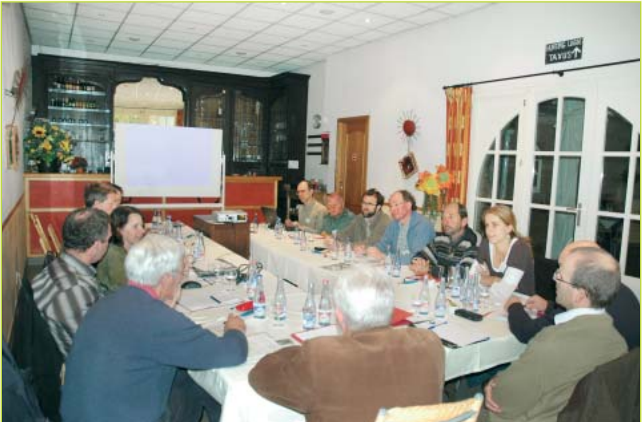
Ook de (on)zin van houtproductie in Vlaanderen werd bediscussieerd door de aanwezige bosbeheerders.