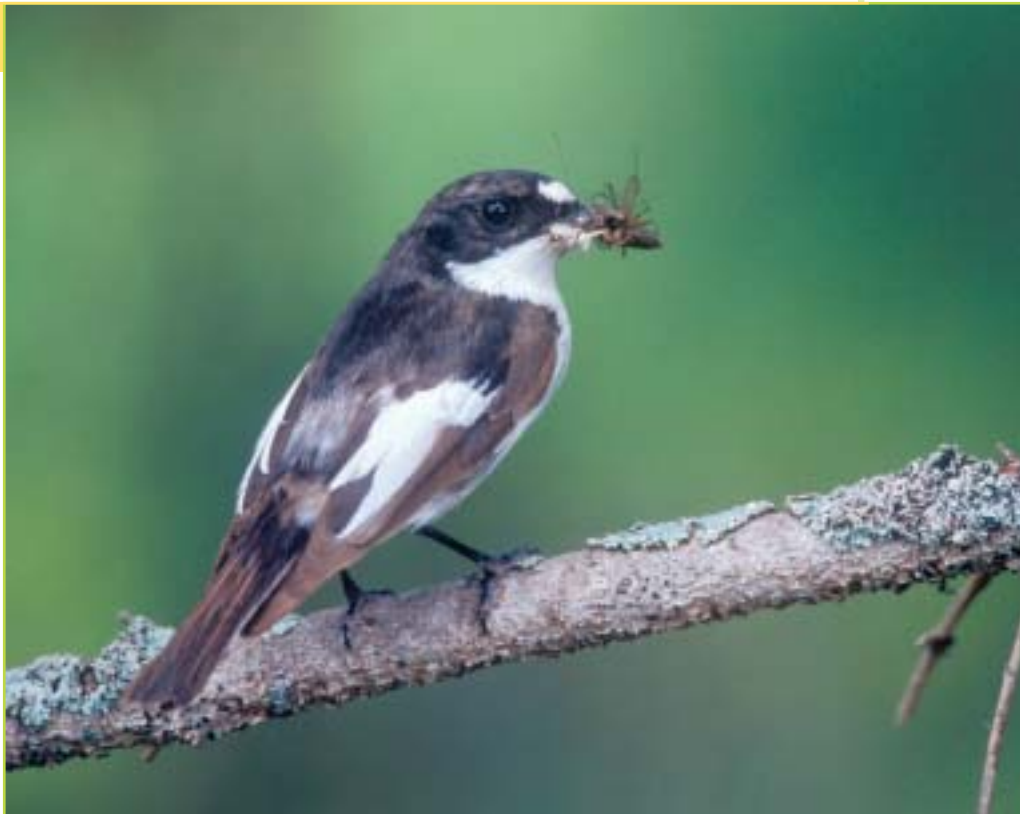
De bonte vliegenvanger overwintert in Afrika. Wanneer hij in het voorjaar weer in Vlaanderen aankomt is de lente verder gevorderd dan voorheen. Daardoor mist hij de rupsenpiek waarmee hij zijn jongen voedt. De bonte vliegenvanger is een van de weinige bosvogels die het niet goed doen.

Het is duidelijk dat we in die omstandigheden de Europese doelstelling om tegen 2010 het verlies aan biodiversiteit te